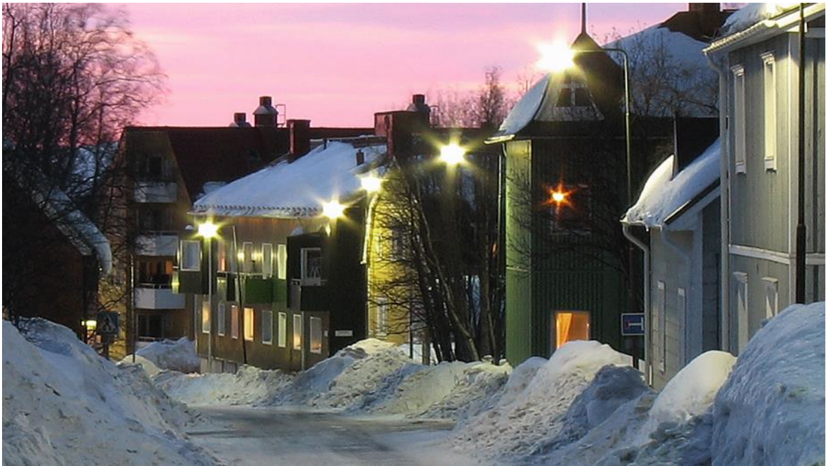
Bild 1. Reenstiernagatan, Kiruna C

Under rubriken "Vi lämnar följande kvalitetsdeklaration" ser du när snöröjningsarbetena startar och hur länge de får ta. Med kvalitetsdeklarationen vill vi att allmänheten ska veta vilka vägar, gång- och cykelvägar som är framkomliga och när.