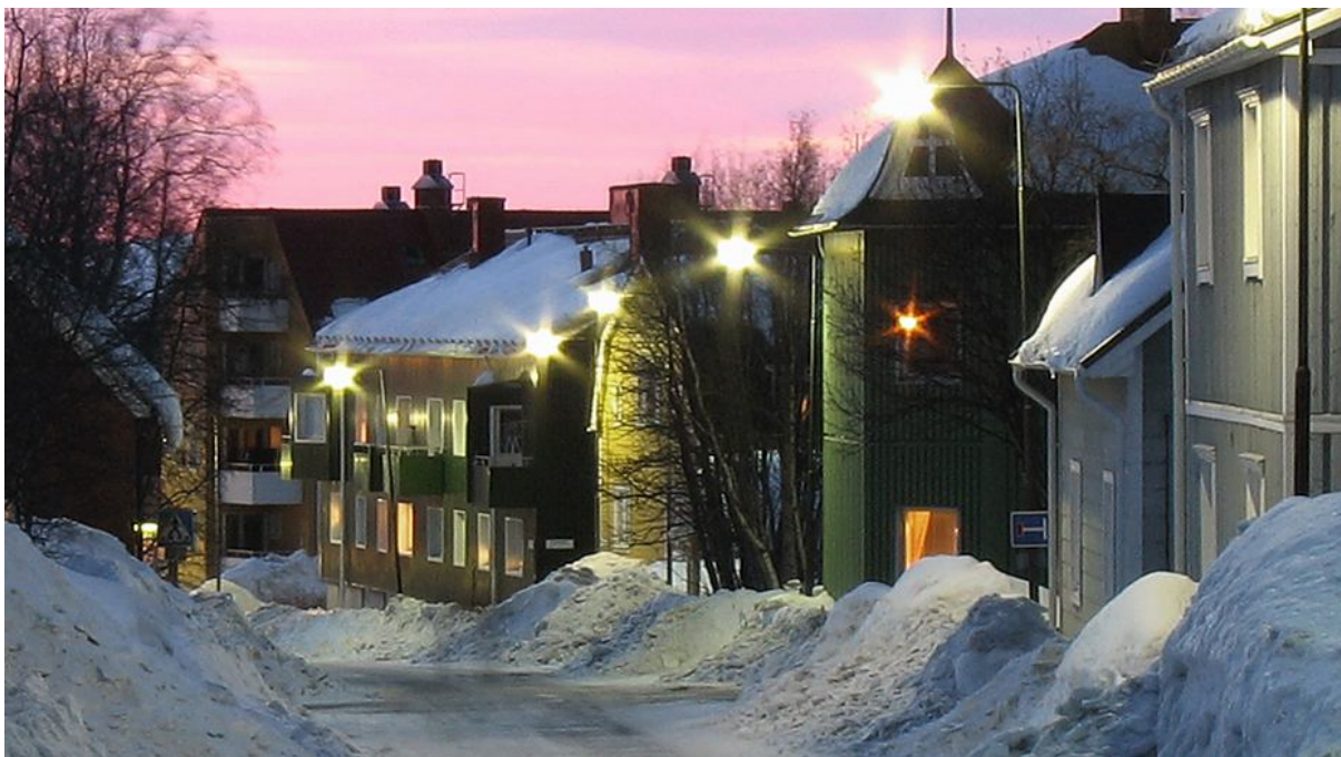
Bild 1. Reenstiernagatan, Kiruna C

Under rubriken "Vi lämnar följande kvalitetsdeklaration" ser du när snöröjningsarbetena startar och hur länge de får ta. Med kvalitetsdeklarationen vill vi att allmänheten ska veta vilka vägar, gång- och cykelvägar som är framkomliga och när.