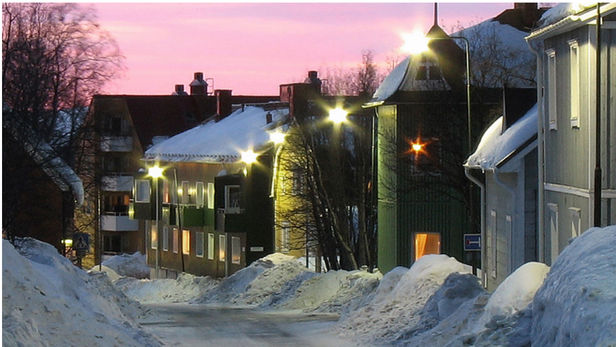
Bild 1. Reenstiernagatan, Kiruna C

Under rubriken "Vi lämnar följande kvalitetsdeklaration" ser du när snöröjningsarbetena startar och hur länge de får ta. Med kvalitetsdeklarationen vill vi att allmänheten ska veta vilka vägar, gång- och cykelvägar som är framkomliga och när.