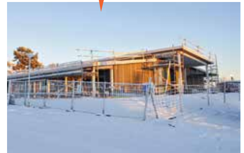
Bygget av ett nytt LSS-boende i Tuolluvaara pågår.