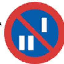
Trafikskylt för datumparkering.

Detta gäller klockan 00.00-08.00 varje dygn. På vissa platser i Kiruna tätort finns det även enkelsidig datumparkering. Det innebär att det endast är tillåtet att parkera på den gatan varannan natt. Anledningen till att vi har datumparkering är för att öka framkomligheten för sophämtningen samt för att underlätta för snöröjningen.