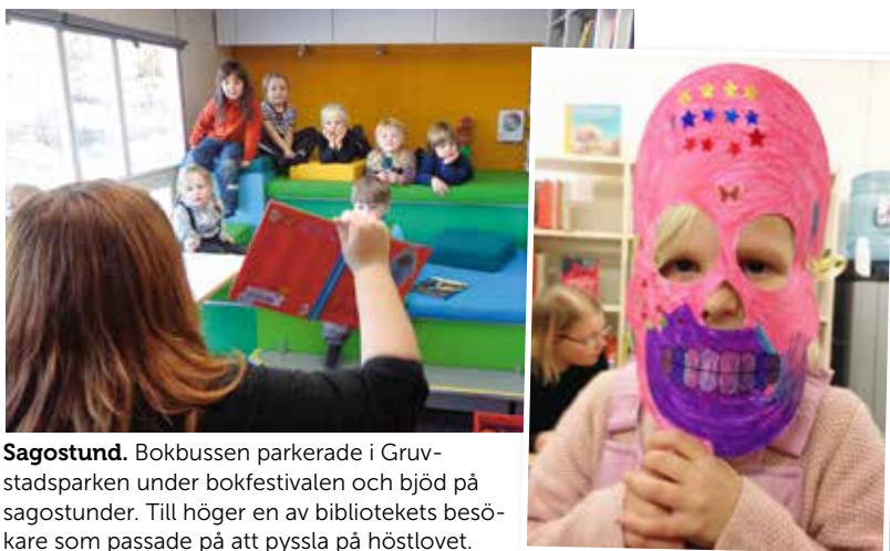
Sagostund. Bokbussen parkerade i Gruvstadsparken under bokfestivalen och bjöd på sagostunder. Till höger en av bibliotekets besökare som passade på att pyssla på höstlovet.