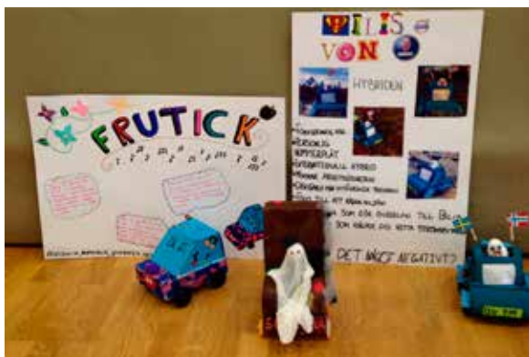
Tävlingsbidrag. Nya Raketskolans båda bidrag samt i mitten det norska vinnarbidraget i Smart Camp-finalen i Narvik 20 maj 2014.