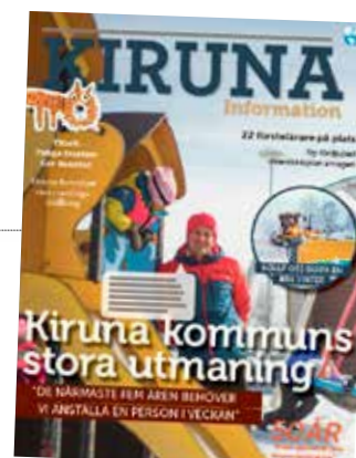
Omslagsbilden till Kiruna Information nr 4/2014 är tagen av Jörgen Medman.

Grafisk produktion: Krauz&Co. reklambyrå