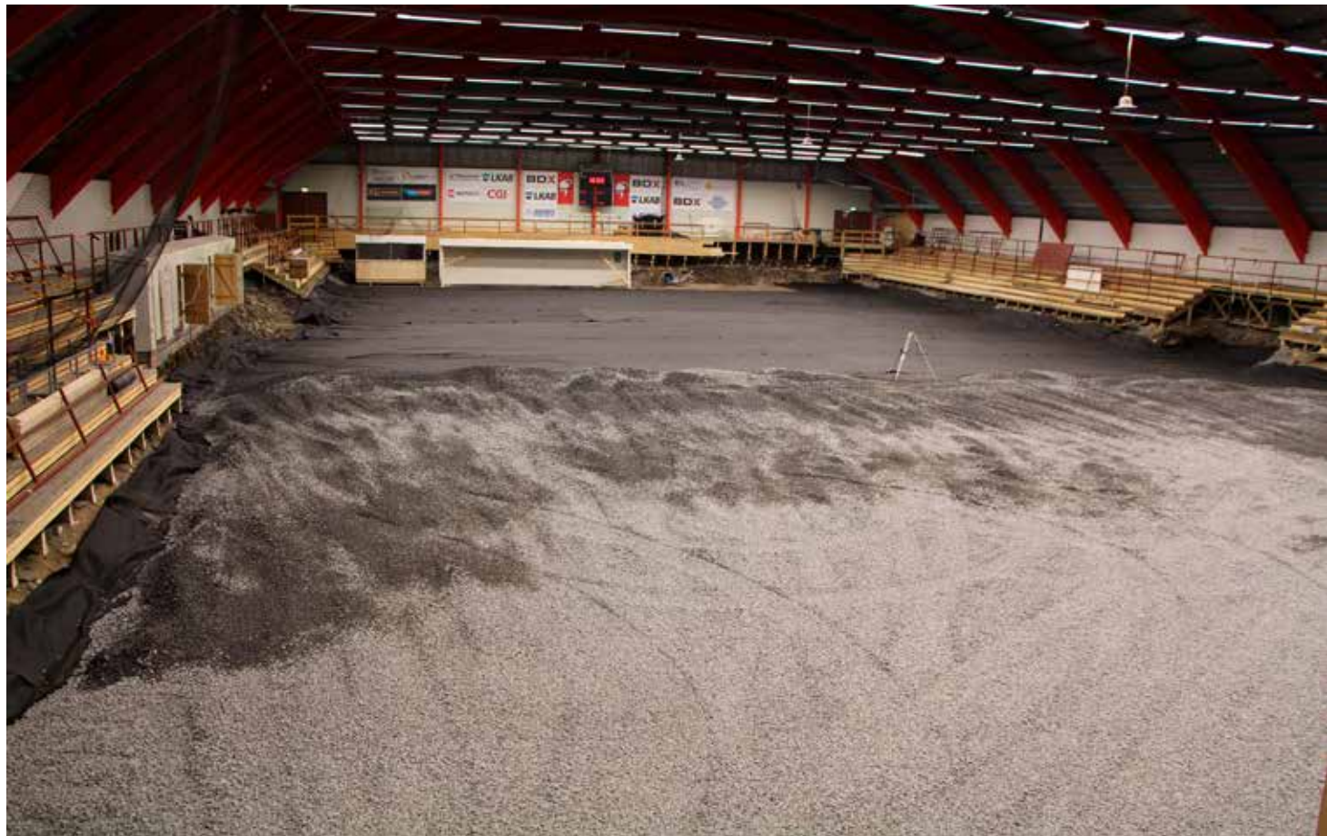
Matojärvi ishall har rustats upp med ny sarg och nytt kylaggregat i sommar.