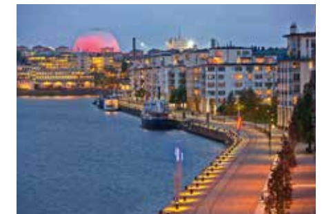
Hammarbyområdet i Stockholm är ett exempel på ett område där det tidigare fanns industrier och som sanerats inför bygget av en ny stadsdel – Hammarby Sjöstad.