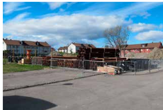
Parhusbygget på Videplan beräknas vara inflyttningsklart i vinter.