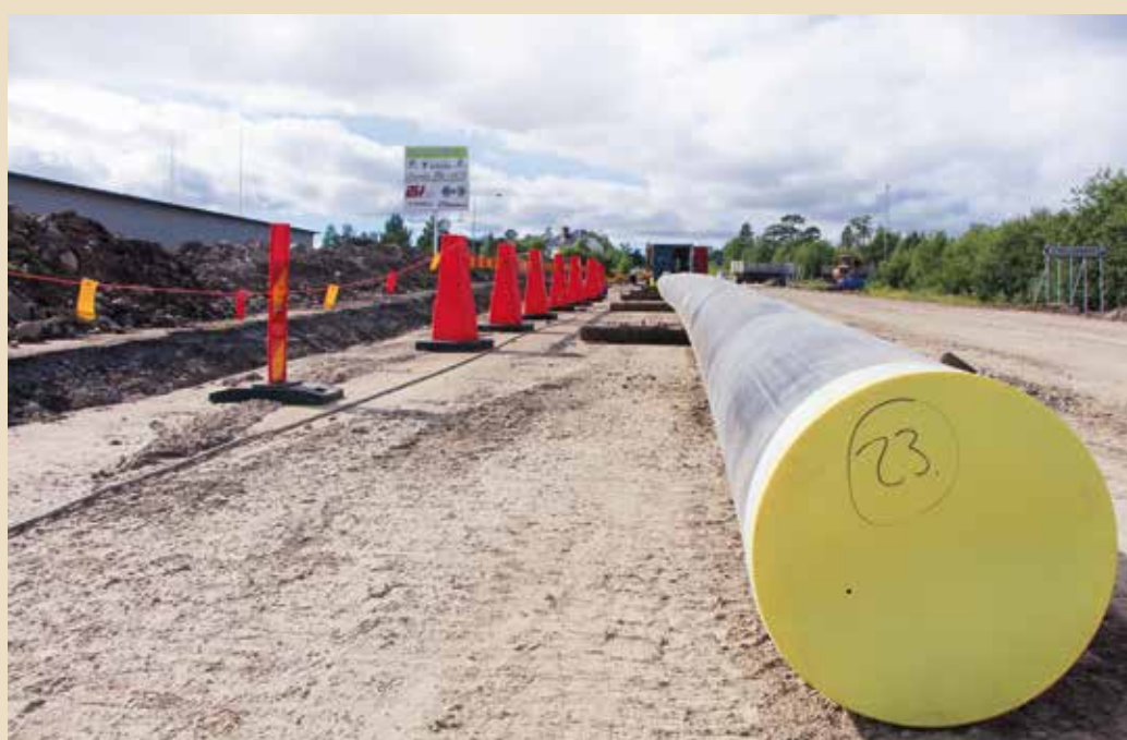
VA-ledningar. Längs Malmvägen gräver man schakt som är fyra meter djupa och tio meter breda för att göra plats åt de nya vatten- och avloppsledningarna.

Kari Venäläinen byggleddare vid förläggningsarbete Malmvägen