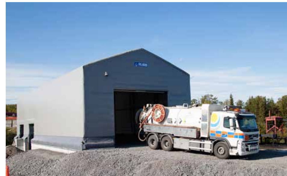
Spillolja och oljeskadat vatten är farligt avfall och måste tas om hand på rätt sätt. Vår nya mottagningsanläggning hjälper både dig och oss att hålla miljön ren.

Text: Stina Johansson