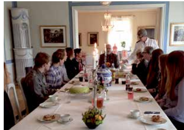
Bild t.h: Stipendiefika hos landshövding Sven-Erik Österberg i residenset i Luleå.