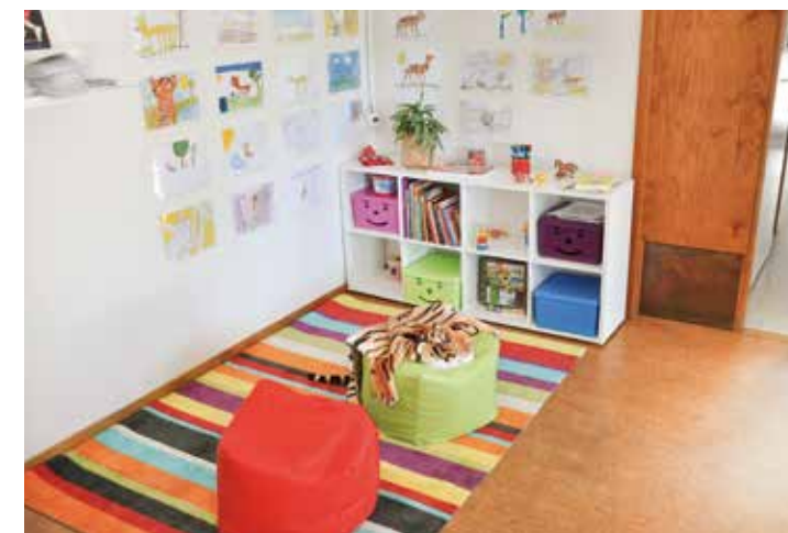
Barnens whörnan i Tigerlokalen. Här träffas.....