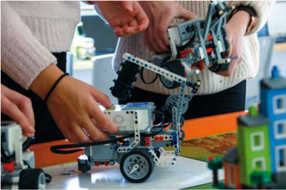
Eleverna fick lösa klimatuppdrag med LEGO.