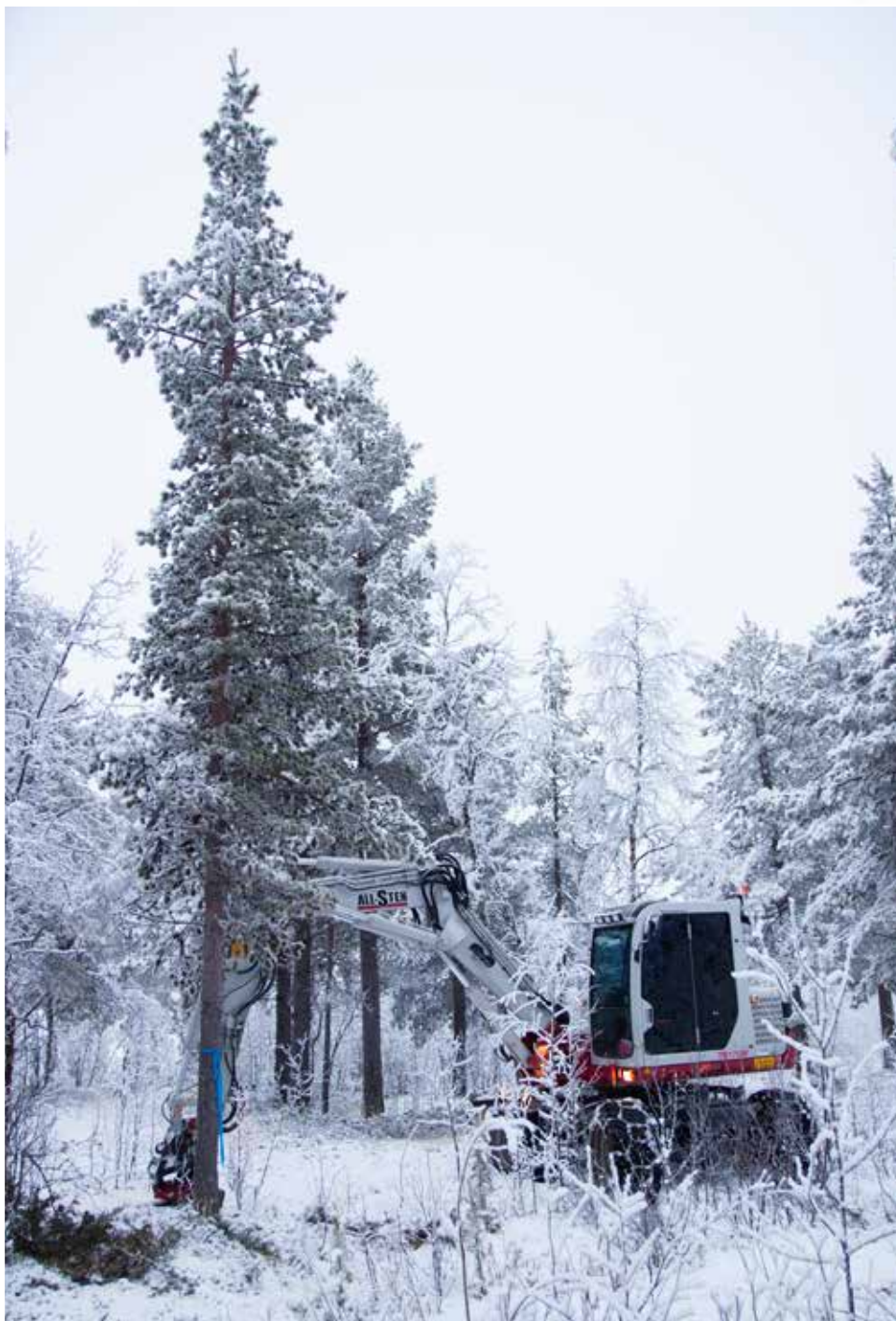
Vid 4:e kilometern, efter Kurravaaravägen, har tallar beskurets och kommer flyttas till nya centrum sommaren 2016.