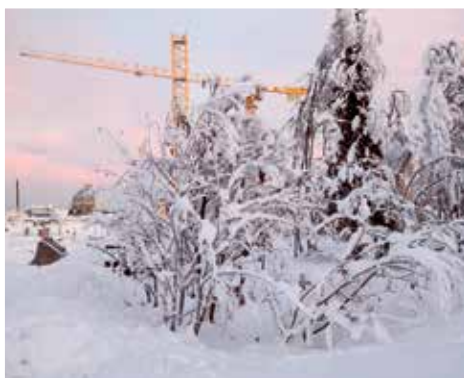
Här ser vi fem rönningar som man tidigt i höstas flyttade till Malmvägen.

Om försöket visar positivt resultat kan Kiruna kommun komma att bygga upp en trädbank så man fortlöpande kan förse nya stadskärnan med träd och buskar. ■