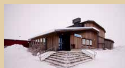
Simhallen i Karesuando.