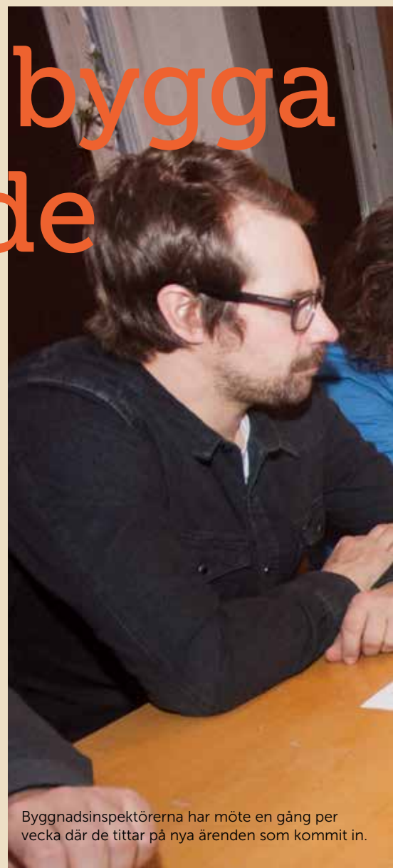
Byggnadsinspektörerna har möte en gång per vecka där de tittar på nya ärenden som kommit in.

Dessa kräver inget bygglov men däremot en anmälan till bygglovskontoret, och som ni ser i statistiken så tar det i genomsnitt 11 dagar för oss att handlägga. Glädjande är att vi Kirunabor har förstått att den här möjligheten finns, då vi på bygglovskontoret hanterar fler "attefallare" än många andra kommuner gör. Mer om Attefallshus får du läsa på nästa uppslag.