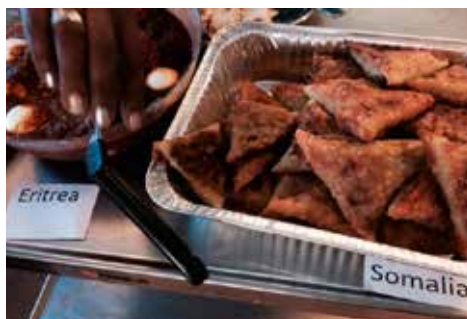
Flera olika länder fanns representerade på buffébordet, här mat från Eritrea och Somalia.

Med tanke på vad som händer i världen kände man att det var aktuellt att på något sätt upp-