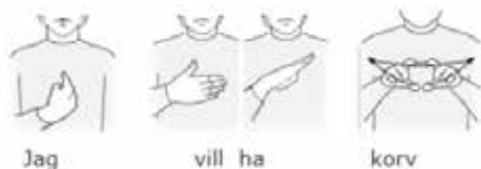
Exempel på bilder med TAKK-tecken.

– TAKK är till för hörande personer med försenad eller avvikande språkutveckling. Det används ofta av och till hörande personer med utvecklingsstörning. Andra som kan behöva stöd av TAKK är barn med tal- och språkstörningar, barn med invandrarbakgrund och barn med hörselnedsättning, berättar Barbro Renberg Solin.