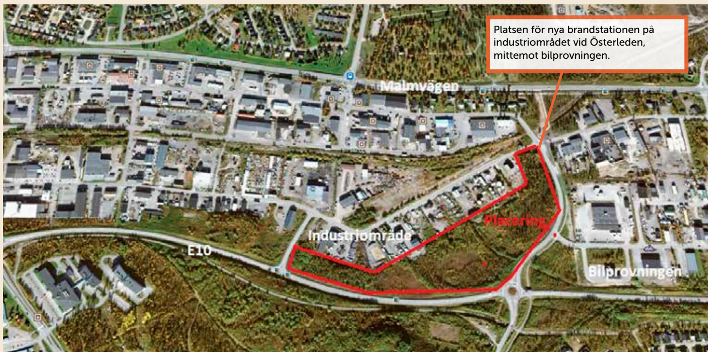
Platsen för nya brandstationen på industriområdet vid Österleden, mitt emot bilprovningen.

Kirunas nya brandstation byggs sydväst om den nya stadskärnan. Placeringen nära bilprovningen ger en strategiskt bra plats med tanke på utryckningstider. Den nya byggnaden ger även plats till ytterligare en av kommunens verksamheter. Text: Ulrika Isaksson och Emma Wodén