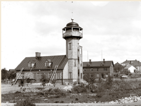
Den gamla brandstationen när den var nybyggd, 10 juli 1910.

En första idéskiss på nya räddningstjänsten. En modern byggnad med detaljer som brandtorn och fasadbeklädnad från våra tidigare brandstationer. Det karaktäristiska brandtornet från Kirunas första brandstation fick även följa med, som en stiliserad kopia, till nuvarande brandstation som invigdes 1994. Illustration: Tirsén & Aili arkitekter