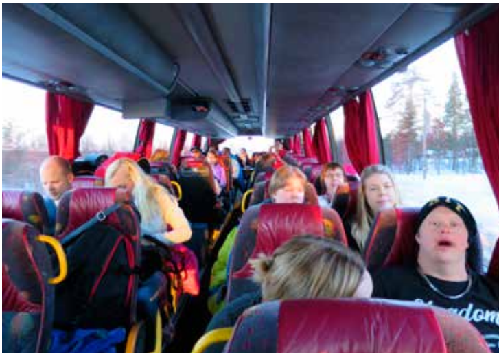
God stämning i bussen, både på dit- och hemresan.