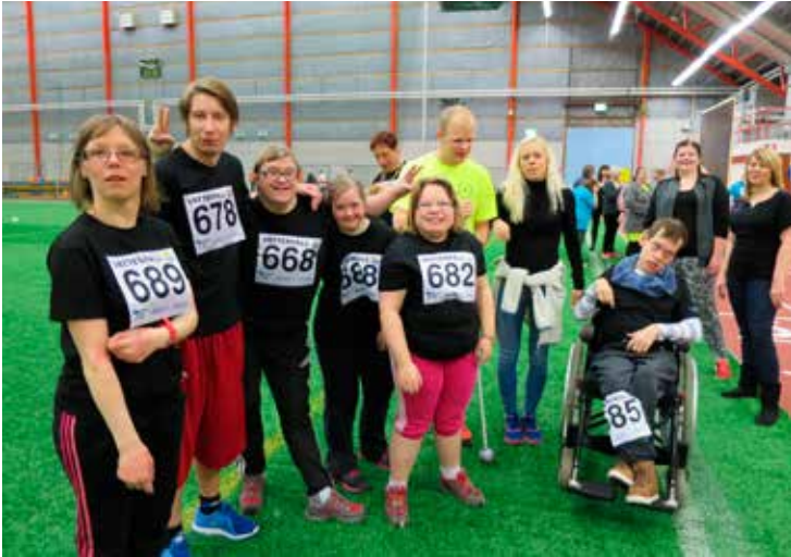
Team Ripan samlade, redo att börja tävla.