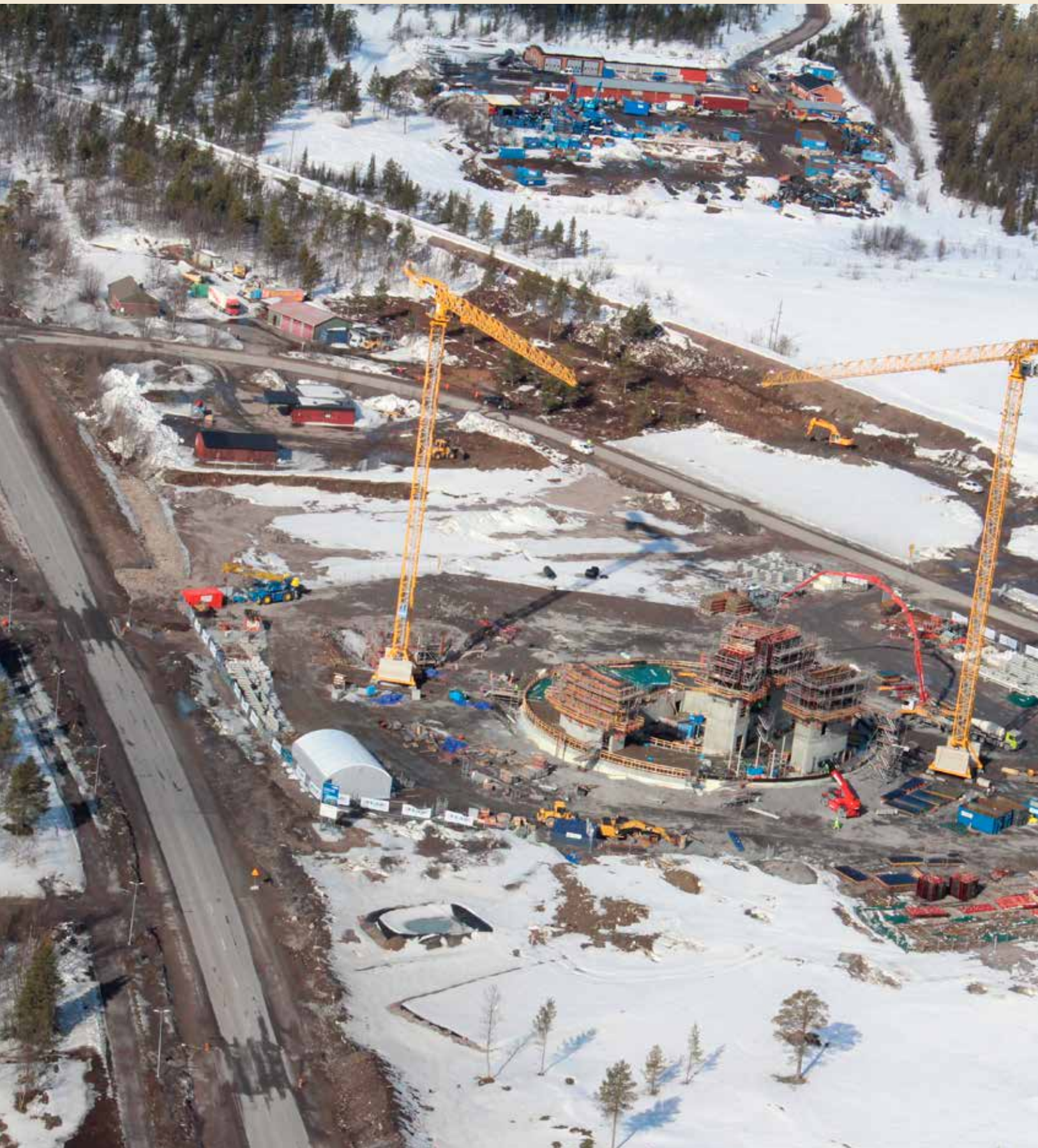
Flygbild över Kirunas nya stadskärna med stadshusbygget centralt i bilden. Bilden är tagen i mars.