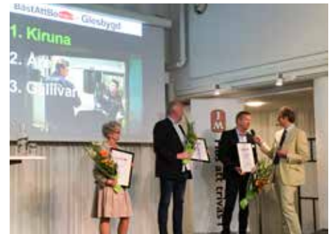
Prisutdelningen skedde i samband med Bäst-att-bo-seminariet i Stockholm den 12 maj.