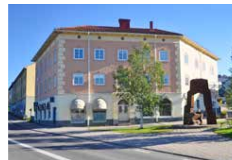
Här hittar du integrationsenheten, Geologgatan 1.

Besöksadress integrationsenheten: Geologgatan 1, Kiruna Hemsida: kiruna.se/Kommun/Invan- dring-integration/Integrationsenheten E-post: integration@kiruna.se Besöksadress Café Metropol: Arent Grapegatan 29, Kiruna