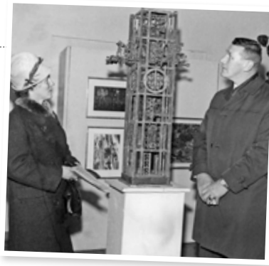
En bild från Hofors, 1968, när tornet var nytt och en modell åkte på turné i Bror Marklunds hemtrakter. En modell av tornet i skala 1:5 av tornets tre översta sektioner finns utställd i Kiruna stadshus. Kom och titta!

Text: Ulrika Isaksson | Foto: Kjell Törmä, Ulrika Hannu