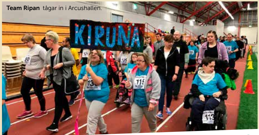
Team Ripan tågar in i Arcushallen.

Givetvis bjuder vi på fika! Varmt välkommen