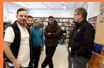
Biblioteksvisningar varje heltimme.