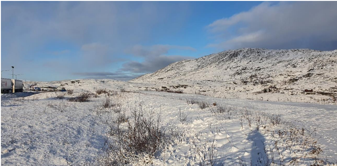
Planområdet med Bjørnfjell i bakgrunden. Vy från infarten från E10.