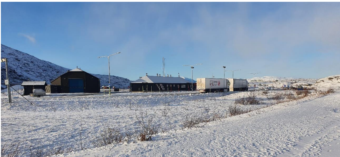
Bjørnfjäll tullstation sett från planområdet.

Planområdet utgörs av en parkeringsyta och körbana med anslutning från E10. Bjørnfjell tullstation består av en huvudbyggnad om cirka 400 m 2 , en garagebyggnad på cirka 200 m 2 samt en mindre förrådsbyggnad. Byggnaderna är mörka träbyggnader i en våning men med varierande höjd och takutformning. Uppskattad högsta nockhöjd för byggnaderna är cirka 7-8 meter.