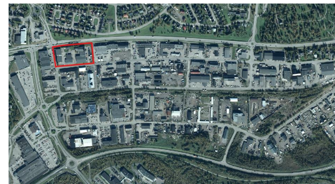
Planområdet markerat i rött.

Planområdet är beläget i västra industriområdet och omfattar fastigheterna Traktorn 10 och Traktorn 11.