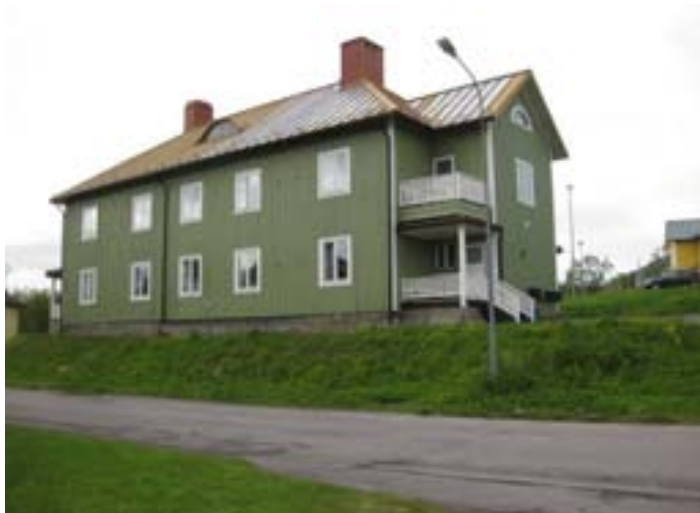
Tvåvåningsfastighet i trä inom område 5.

Området har stora kulturmiljövärden med en bevarad bebyggelse som representerar varianter på de äldsta arbetarbostäderna som uppfördes i början av sekelskiftet 1900. Gatunätet har mellan åren 1915 och 1961 ändrats radikalt. ”Ångköksgatan” har helt försvunnit och Gruvfogdegatan fått en ny sträckning.