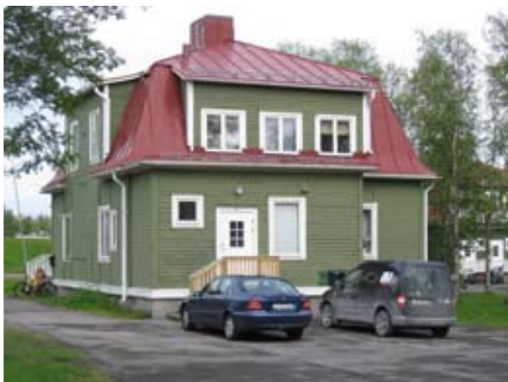
Exempel på Bläckhorn i trä inom område 5.