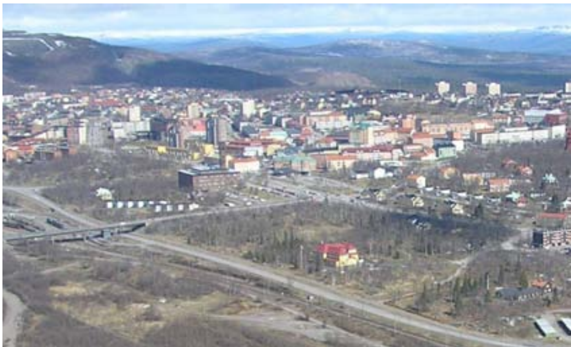
Flygbild maj 2007 med Bolagshotellet i centrum och Disponentbostaden till höger i bild .