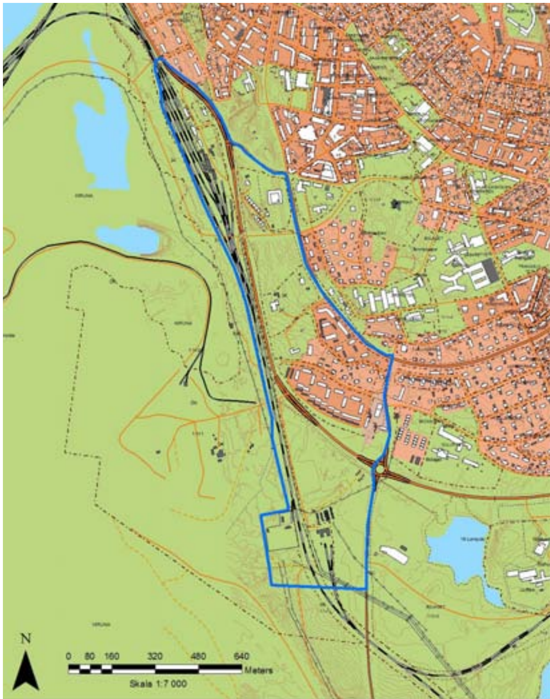
Figur 1. Aktuellt planområde Gruvstadsparken.