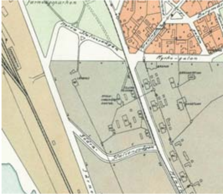
Figur 8. Utsnitt ur 1915 års stadsplan över Kiruna som inom ett område som motsvarar analysens område 2.

Området har en kontinuitet såsom funktion som centrum för municipal och kommunal förvaltning. Två bevarade trähus från tidigt 1900-tal förstärker upplevelsen av bebyggelsekontinuitet. Kirunas stadsrättigheter manifesteras av det pampiga stadshuset. Radhusen på Lingonstigen skiljer sig från mot den övrig bebyggelsens ursprungliga och nuvarande funktion och historia. Områdets gatunät är relativt oförändrat.