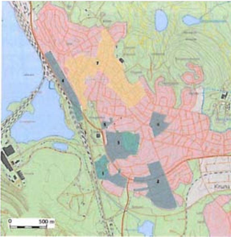
Figur 6 Utpökade bevarandevärda miljöer.

I kommunens bevarandeplan från 1984 redovisas sju miljöer vilka kommunen i olika grad anser vara bevarandevärd.