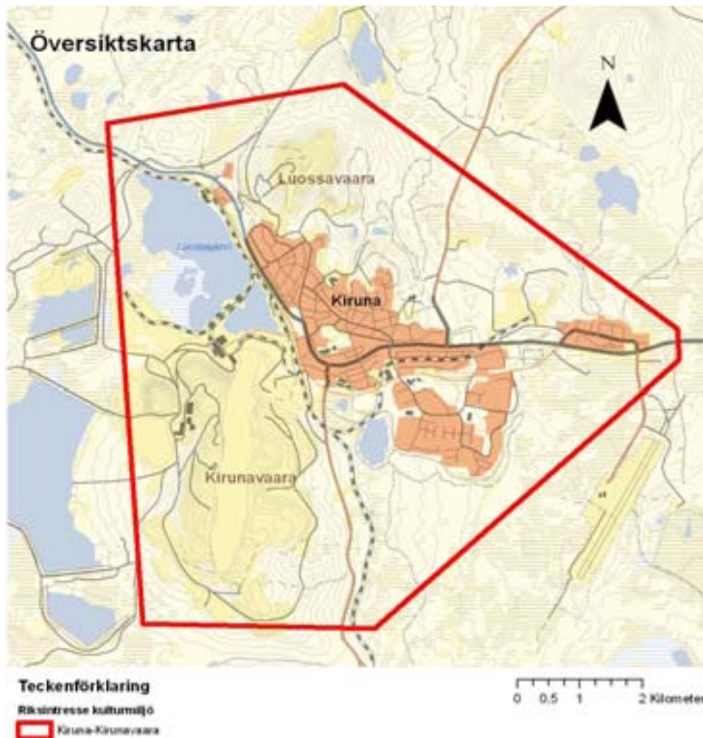
Figur 2. Riksintresseområdets avgränsning.

Riksantikvarieämbetet har under 2009 arbetat med att förnya skrivningen kring riksintresset Kiruna-Kirunavaara.