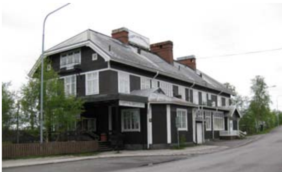
Järnvägshotellet juni 2009.

Hotell Rallaren uppfördes ursprungligen som ett boställshus för SJ:s tjänstemän. Ytterligare ett boställshus fanns tidigare invid det som idag är hotell.