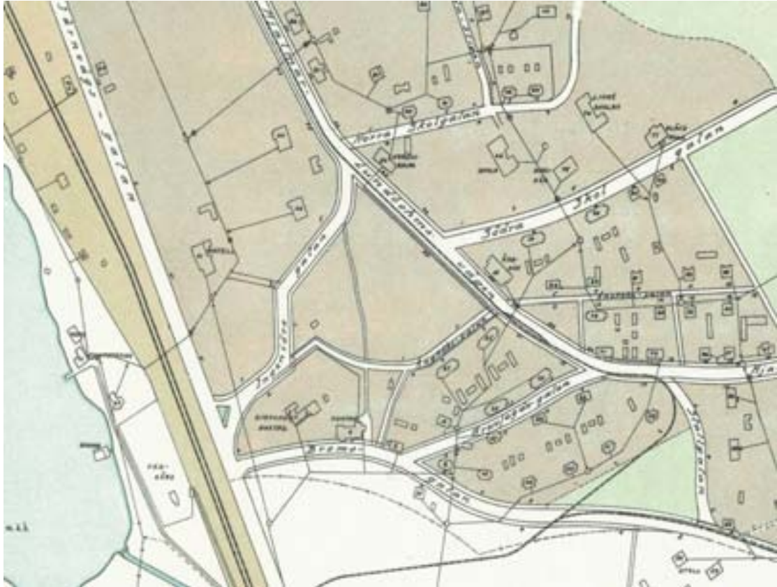
Figur 9 Utsnitt ur 1915 års stadsplan över Kiruna över ett område som motsvarar analysens område 3-6.

Kulturmiljöns bebyggelse och stora tomterna bildar tillsammans en kulturhistorisk helhet vilken varit av vikt såsom bostadshus för högre tjänstemän samt för representation. Gatunätets struktur har från att ha varit en bred infart från stora vägen idag reducerats till en återvändsgränd vid Hjalmar Lundbohmsgården.