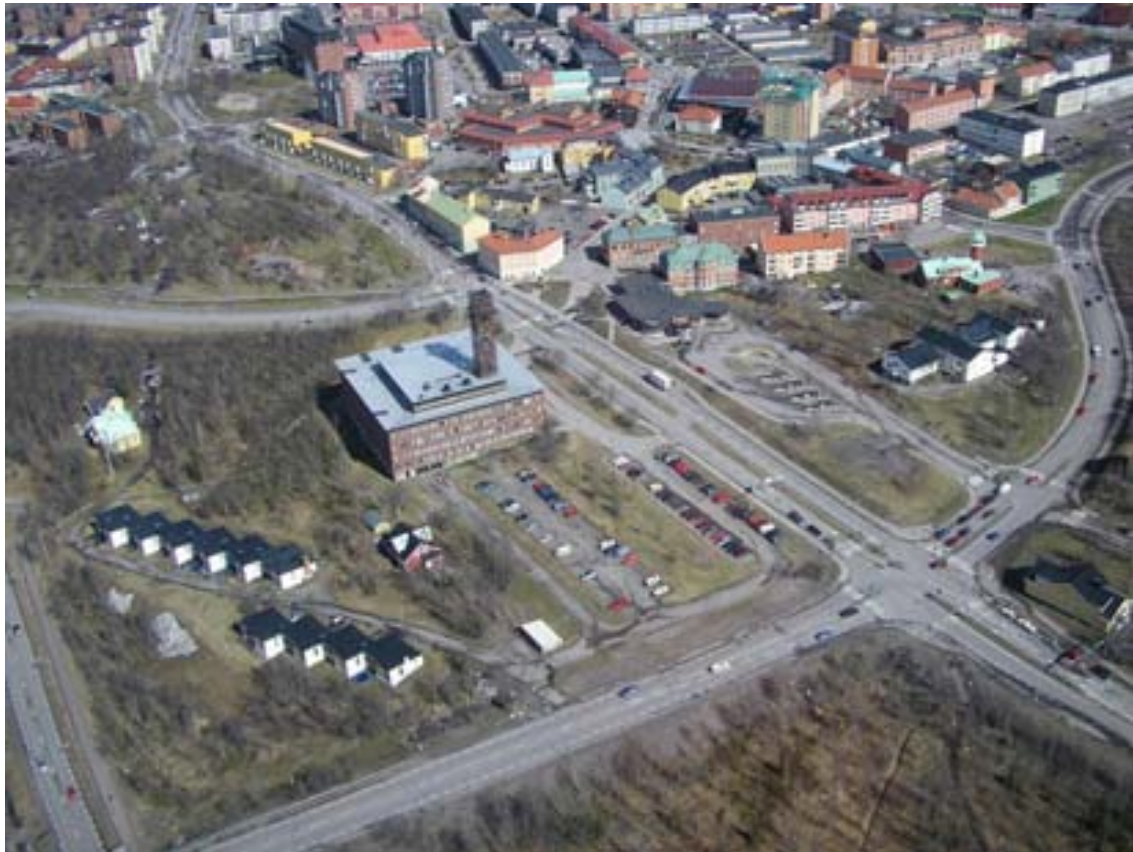
Flygbild maj 2007 med Kiruna stadshus i centrum område 2.