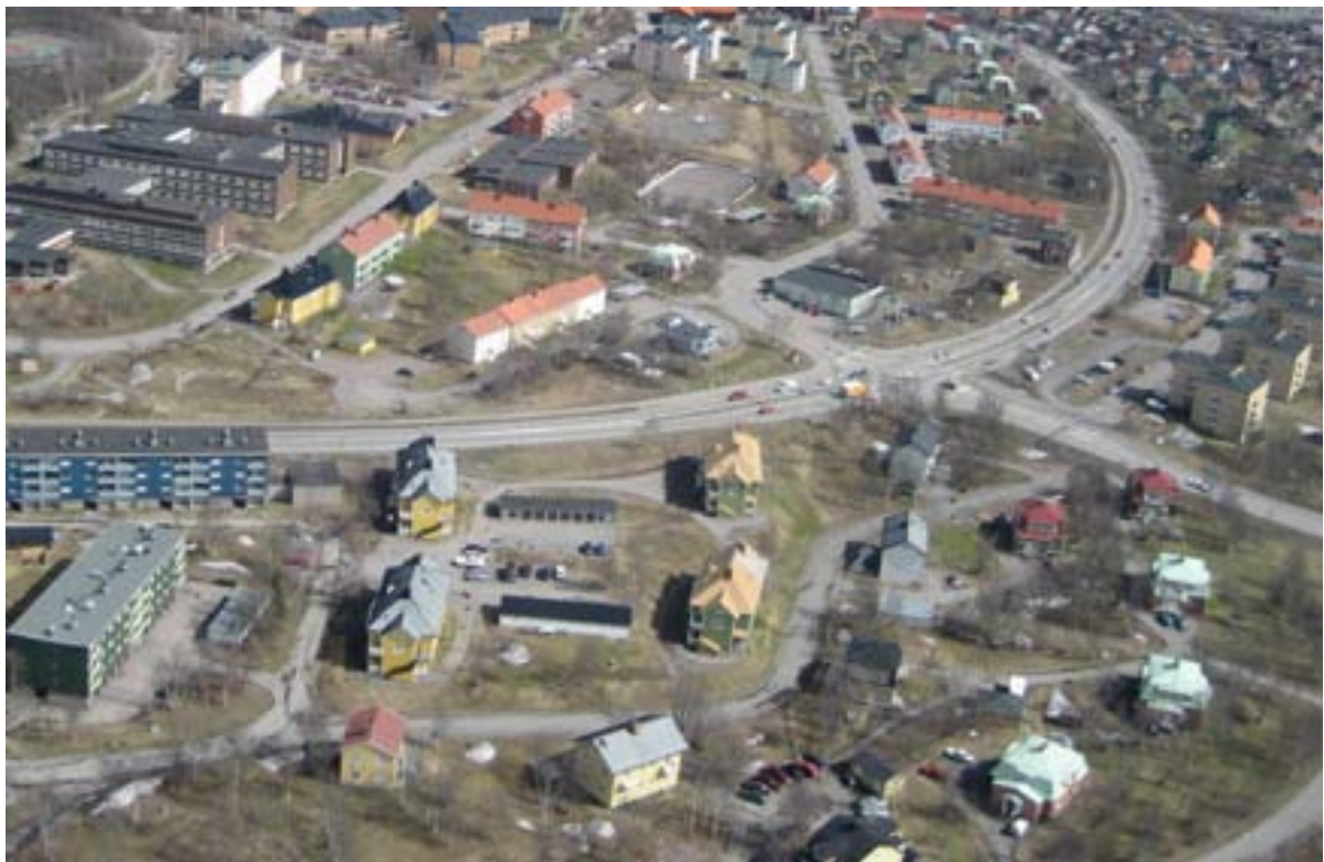
Flygfoto över del av område 5.