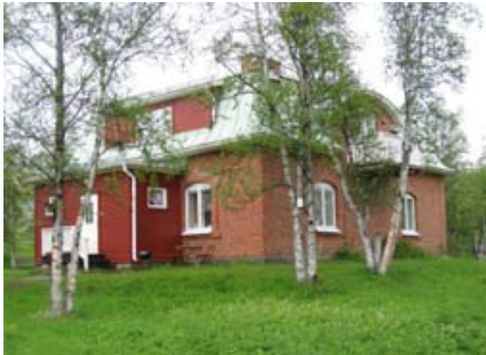
Exempel på Bläckhorn i tegel inom område 5.

Samtliga byggnader inom område 5 är utpekade som bevarandevärda (1984).