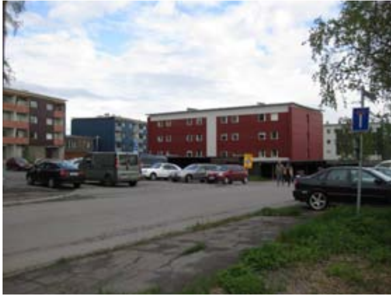
Hyreshusen inom område 4.

Hyreshusen är ett exempel på bostadsbyggande i ett samhälle med högkonjunktur och behov av bostäder. Liksom för Kv. Ullspiran är bebyggelsens formspråk likriktad med övrig samtida bostadsområden i Sverige.