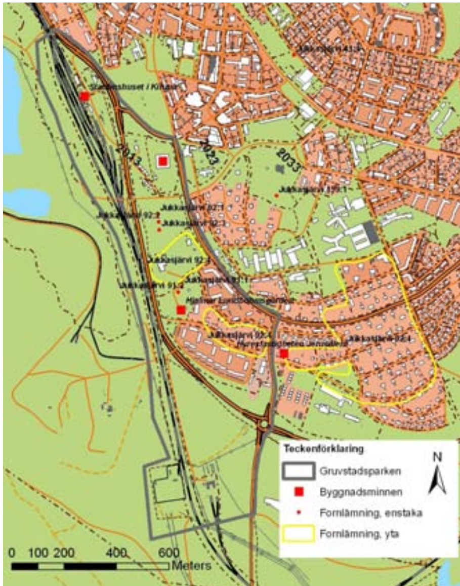
Figur 5. Gruvstadsparkens avgränsning samt förekommande fornlämningar och byggnadsminnen.