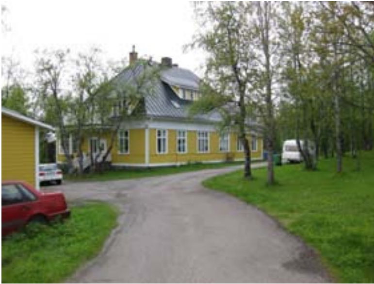
Kvarvarande Ingenjörsbostad inom område 3.