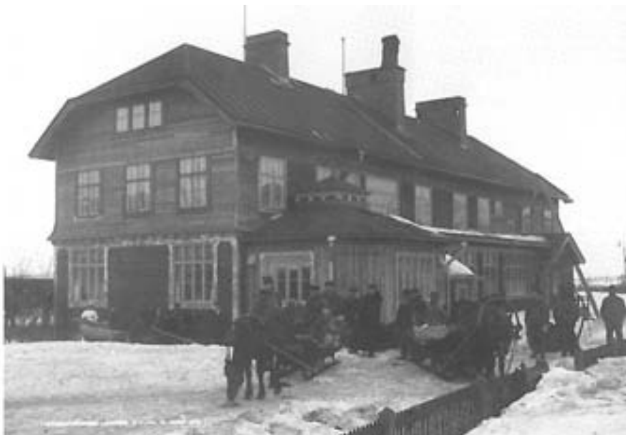
Järnvägshotellet i Kiruna i mars 1910.