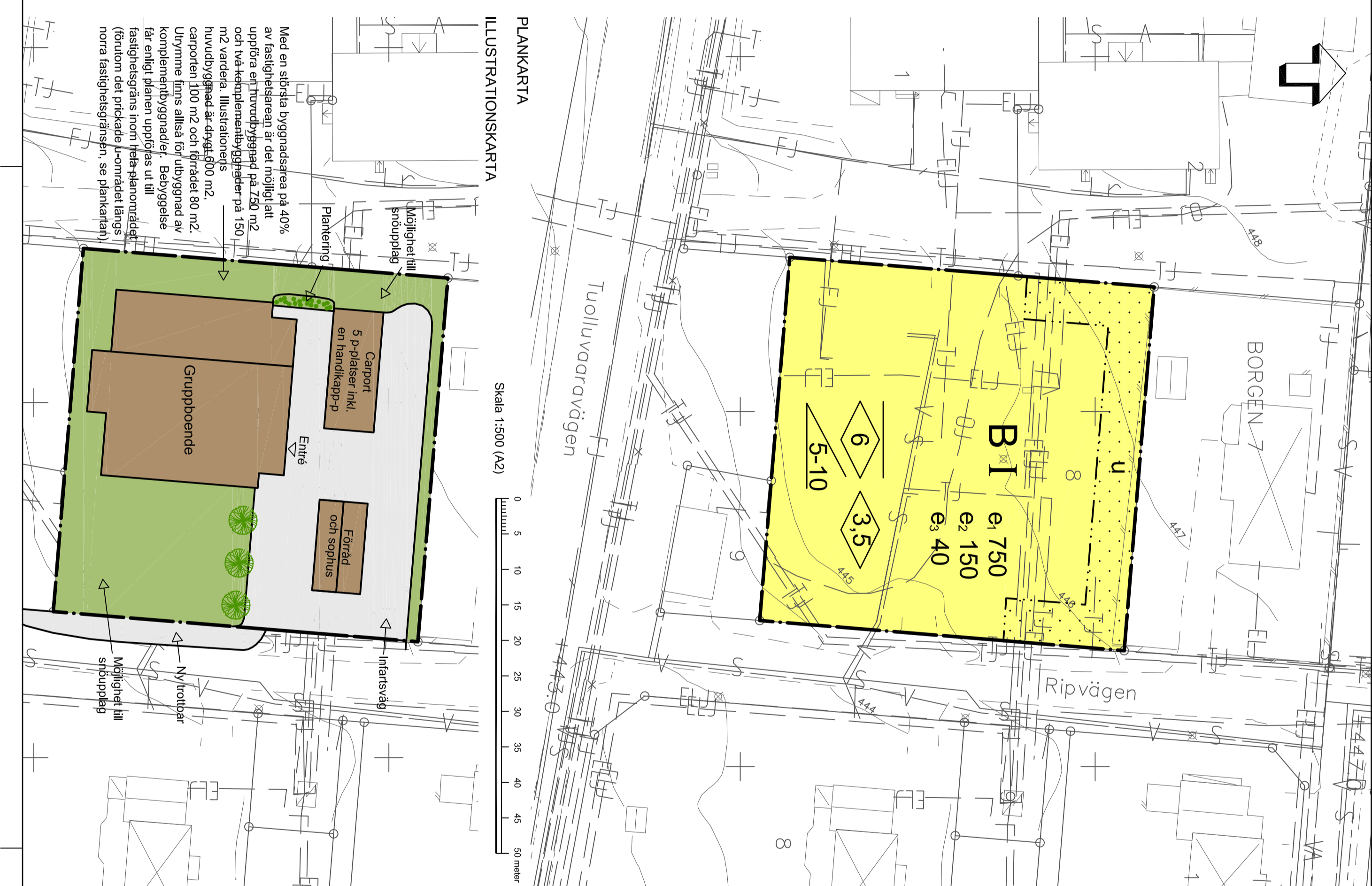
SKALA 1:500 (A2)