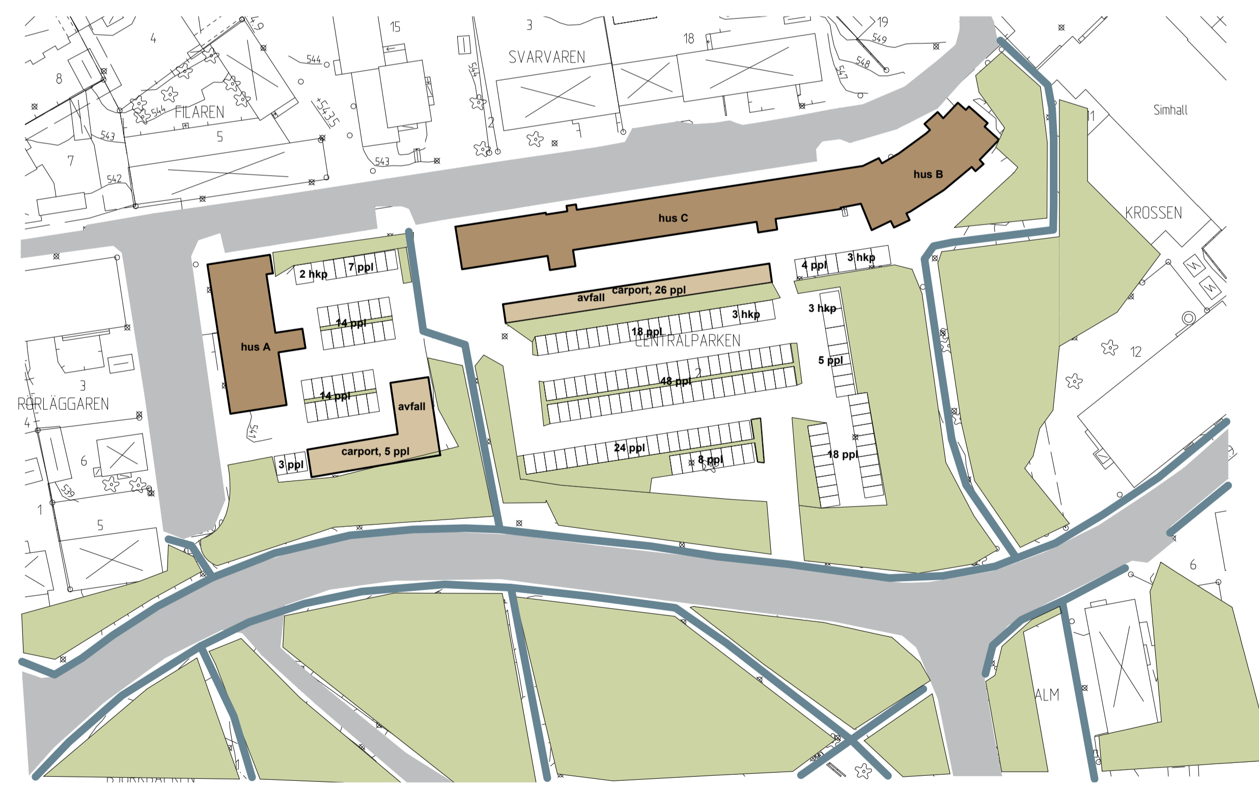
Skala: 1:2000 (A1) 1:4000 (A3)