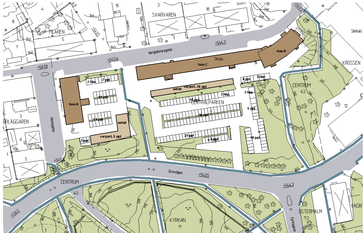
Figur 2. Planillustration.

Flertalet ledningar korsar planområdet vilket medför att särskilda överenskommelser måste upprättas mellan kommun och ledningsägaren. Flytt eller förändring av ledningarnas läge bekostas av exploitören.