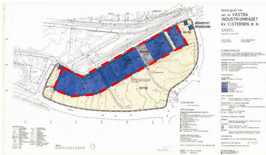
Gällande detaljplan från 1990 med den avgränsning som avser planändringen.

Planen tillåter en tomt för bensin med tillåten utnyttjandegrad att bygga 16 procent av fastigheten yta där minsta tomtstorlek är 3400 kvm. Tomterna för industri och upplag med samma tillåtna minsta tomtstorlek får bygga 35 procent av fastighetens yta, vilket motiverar att öka utnyttjandegraden för bensinändamål till samma andel (35 procent). Det finns inga underjordiska VA-ledningar eller fjärrvärmeledningar inom aktuellt område som hindrar en större exploateringsgrad. En fullt utnyttjad byggrätt ska kunna tillgodose behovet av parkeringsplatser inom tomten, enligt kommunens parkeringsnorm (antagen av miljö- och byggnämnden år 2007), om marken nyttjas för motellverksamhet. Motellverksamhet tillåts inom ändamålet bensin och är den verksamhet som enligt p-normen har det högsta normtalet per 1000 kvm bruttoarea. Parkeringsbehovet enligt kommunens parkeringsnorm ska tillgodoses vid bygglovshandlingen.