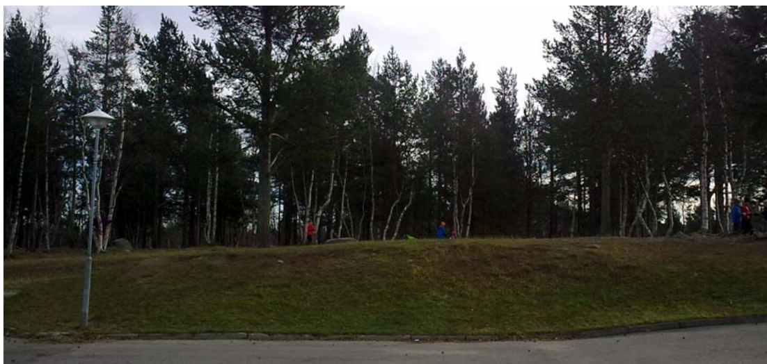
Skogsdunge som ska sparas för barnen att vistas och leka i.

Det tidigare planlagda skolområdet utökas och medger nu även en idrottshall. Byggnaden för idrottshall placeras intill befintlig bollplan, i ett område som är oexploaterat, men planlagt för allmänt ändamål. Vintertid anordnas isbana på den befintliga bollplanen, vilket blir möjligt också i fortsättningen. Ytan för den befintliga bollplanen minskas och en del av ytan kommer att nyttjas för besöksparkering.