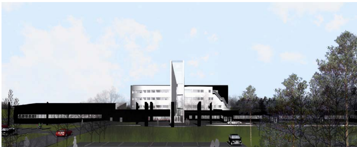
Bild 1. Illustration av nya Raketskolan, ritad av arkitekt Mats Jakobsson, MAF Arkitektkontor

Kulturella aspekter: Skolans viktiga roll i samhället – landmärke, skapa lust för lärande, ge byggnaden ett symbolvärde