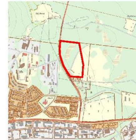
ÖVERSIKTSKARTA. Planområdet markerat med röd linje