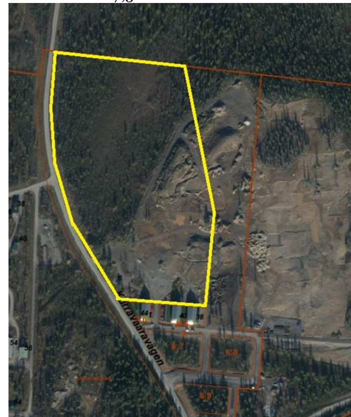
Planområdet markerat i gul

Planområdet ligger i nordöstra delen av staden Kiruna, ca 1 kilometer från nya centrum. Området omfattar delar av Jägarskolan 8:3. Det begränsas i väster av Kurravaaravägen (väg 874). I norr och i öster ansluter planområdet till naturmark. Jägarskolan 8:6 med studentbostäder som byggdes 2016 och ytterligare bostäder som är under uppförande ligger söder om planområdet. Planområdet omfattar cirka 7,5 hektar.