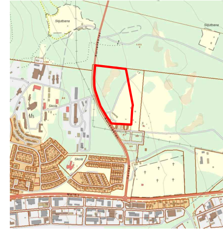
ÖVERSIKTSKARTA. Planområdet markerat med röd linje