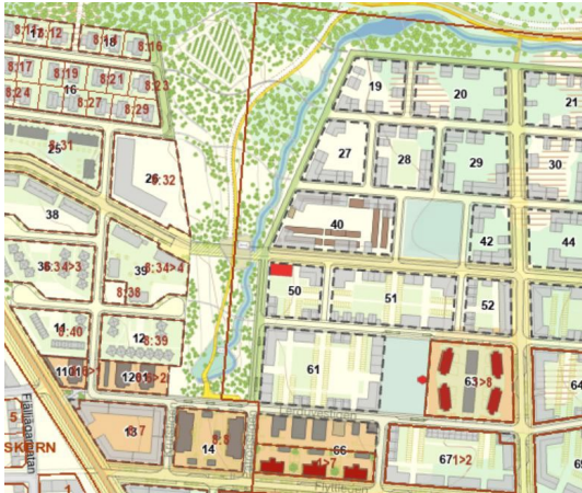
Figur 2. Placeringsalternativ 2 är på kvarter 12.

Lokaliseringsalternativ 2, avser kvarter 12 (se figur 2). Detta kvarter angränsar till nuvarande studentbostäder invid Kurravaaravägen.