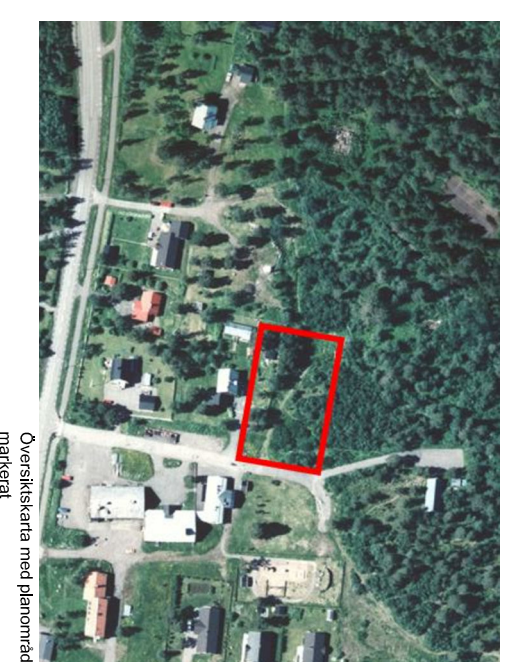
Oversiktskarta med planområdet markerat