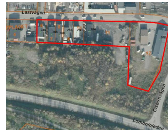
Planområdet markerat i rött