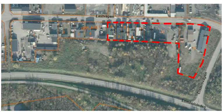
Översiktskarta. Planområde markerat med rött.

Koordinatsystem i höjd RH 2000 Koordinatsystem i plan Sweref 99 20 15 Kartan upprättad 2018-03-23 av Fredrik Stöckel, Metria AB