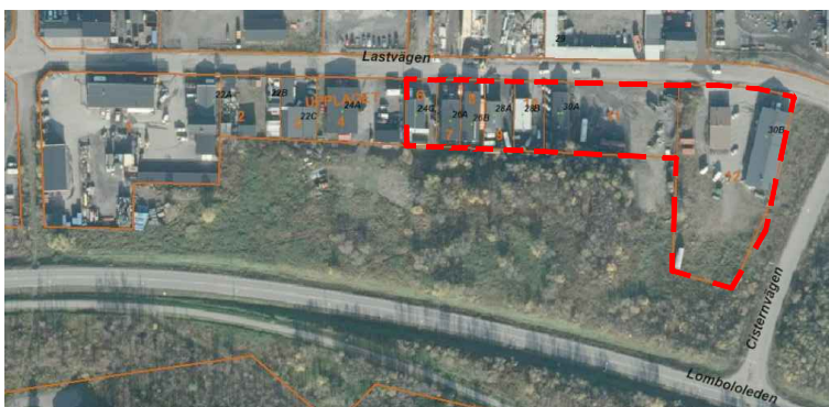
Översiktskarta. Planområde markerat med rött.

Koordinatsystem i höjd RH 2000 Koordinatsystem i plan Sweref 99 20 15 Kartan upprättad 2018-03-23 av Fredrik Stöckel, Metria AB