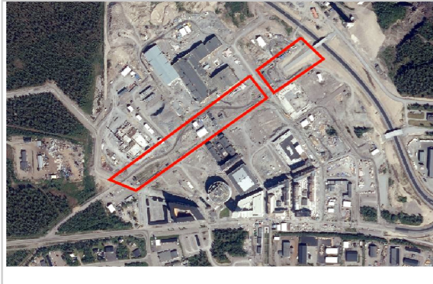
ÖVERSIKTSKARTA. Planområde markerat i rött.