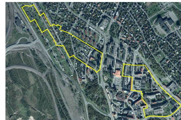
Planområdet markerat i gult

Planområdet omfattar drygt knappt 19 hektar (187545 m 2 ).