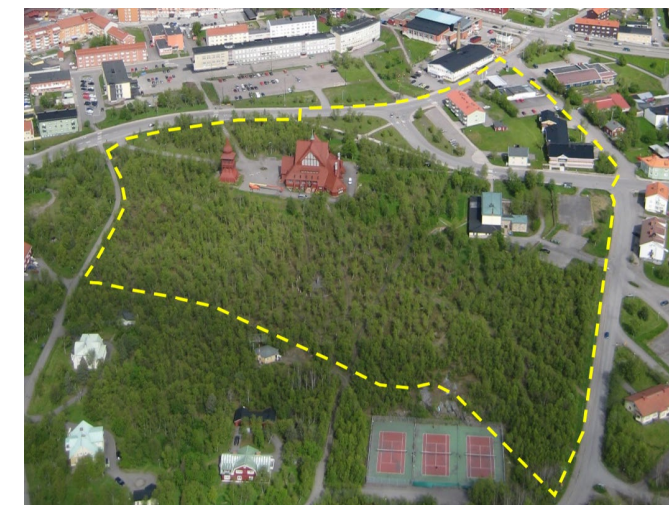
Planområdet ungefärligt markerat i gult

Planområdet är ca 7 hektar (69 555 m 2 ).