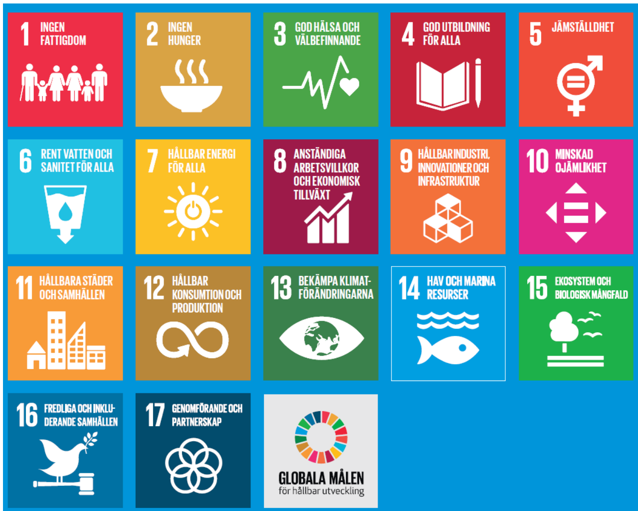
Utdrag ur Agenda 2030 och de globala målen för hållbar utveckling - Ett material från projektet Glokala Sverige - Agenda 2030 i kommuner, landsting och regioner