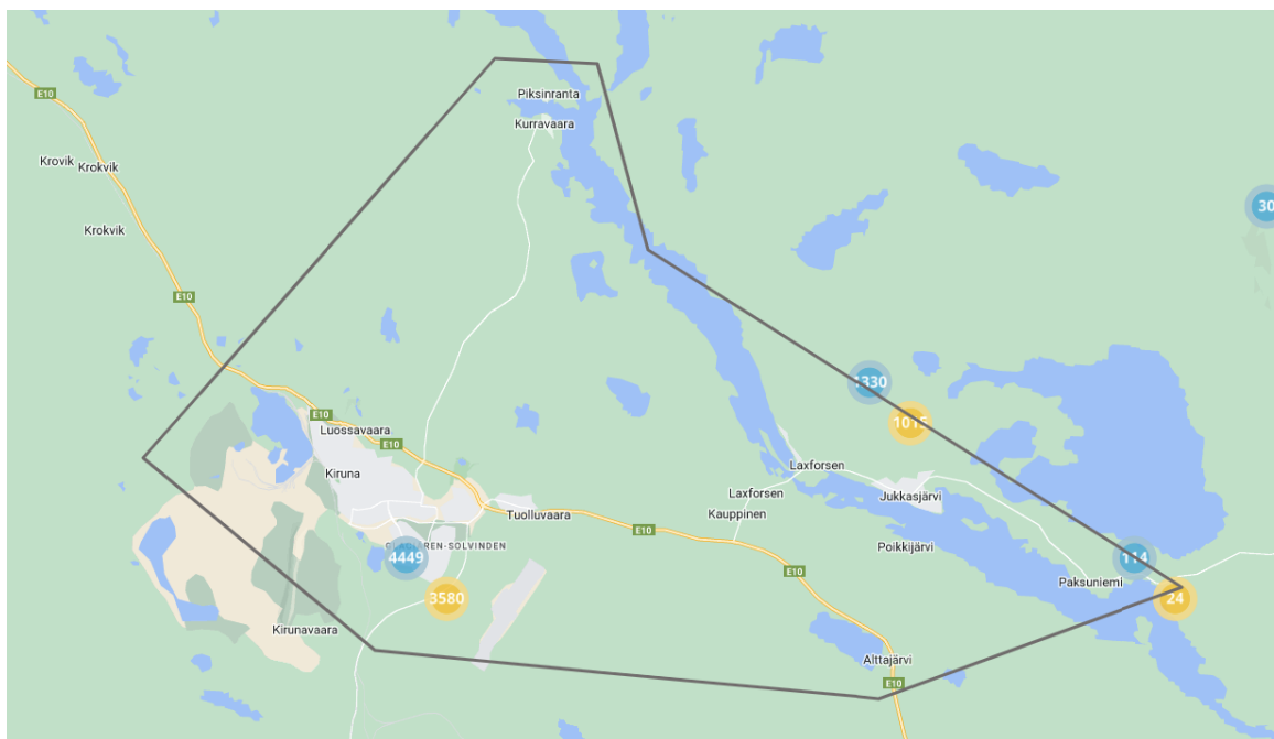
Söksområde för bolagsägda småhusfastigheter. Sökkriterier: Tomtareal = <10 000 kvm, Typkod = 2xx