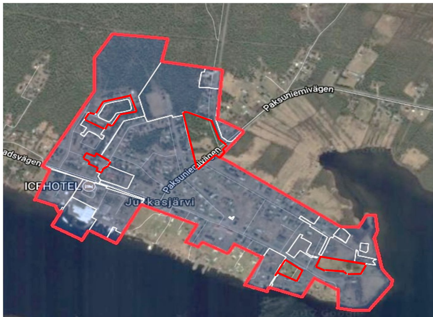
Detaljplanen berör vägarna inom området som är markerat med rött