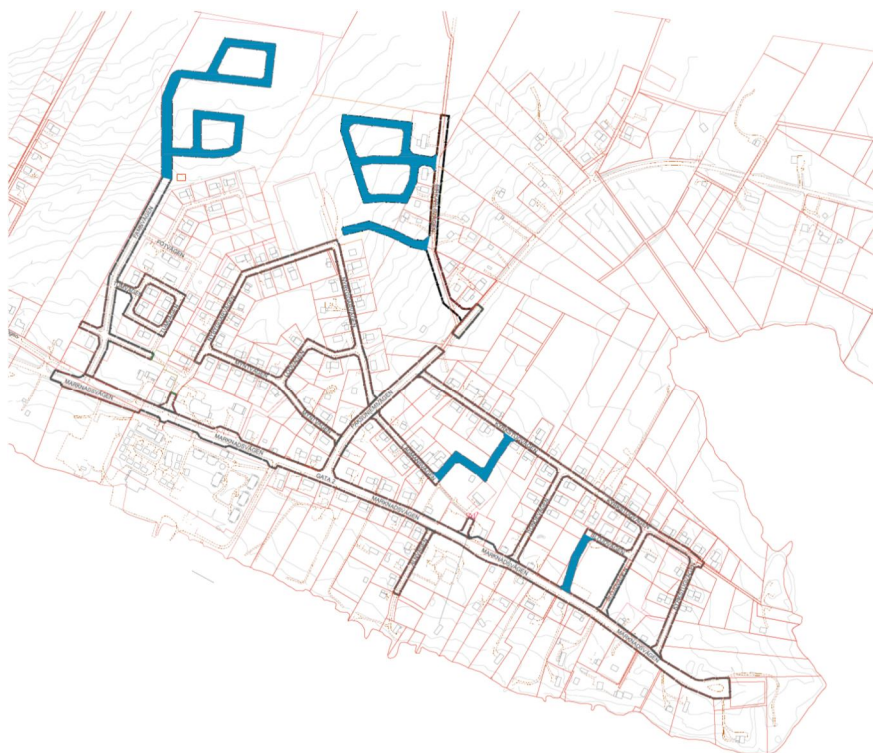
Bild 3. Gator markerade i blått är vägar som är planlagda, men ännu inte utbyggda.