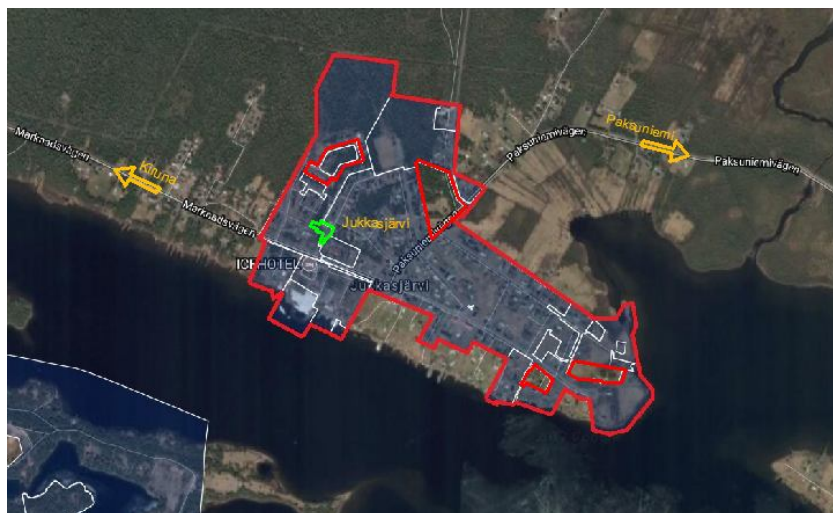
Bild 1. Detaljplanen berör vägarna inom området som är markerat med rött

Planområdet omfattar delar av Jukkasjärvi by, se bild 1 sid. 4. Jukkasjärvi är en tätort i Kiruna kommun belägen på norra stranden vid Torne älv. Byn ligger drygt 17 kilometer öster om Kiruna. Detaljplanen berör vägarna inom området som är markerat med rött i karta nedan. Det område som är markerat grönt kommer att behandlas i separat detaljplan (Kommunstyrelsen sammanträdesprotokoll 2015-05-18 § 147), se bild 1 sid. 4.