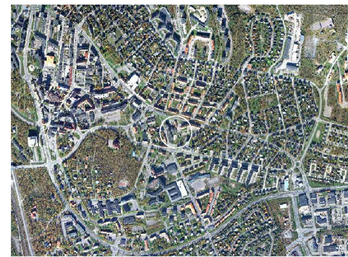
Översiktskarta. Planområde inringat.