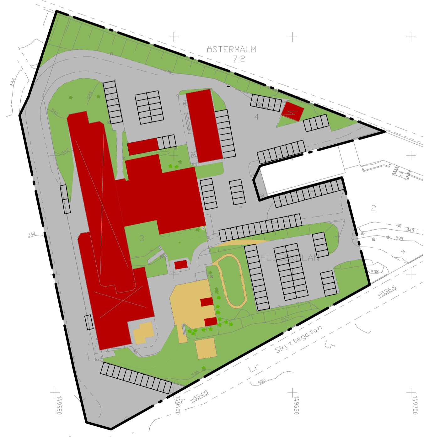
Illustrationskarta. Förslag på hur området kan se ut. Skala 1:1000 (A1)

Klara Blommegård Planarkitekt, Tyréns AB