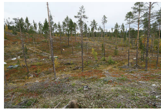
VBM DB 618_011.JPG