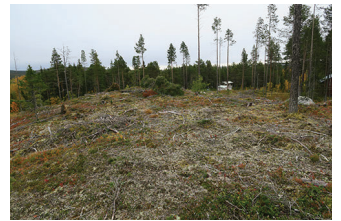
VBM DB 618_016.JPG