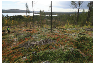
VBM DB 618_007.JPG