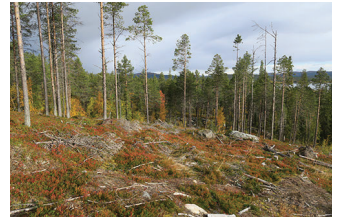
VBM DB 618_004.JPG