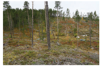
VBM DB 618_012.JPG