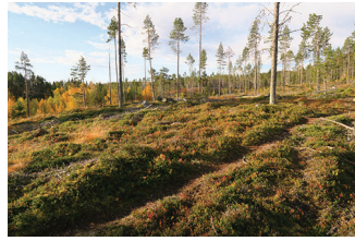
VBM DB 618_002.JPG