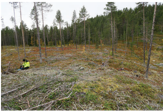
VBM DB 618_013.JPG