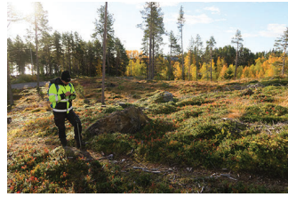
VBM DB 618_003.JPG