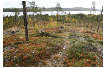
VBM DB 618_008.JPG