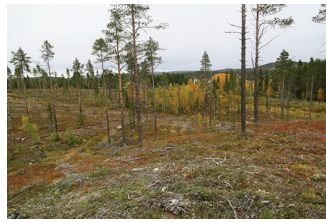
VBM DB 618_010.JPG