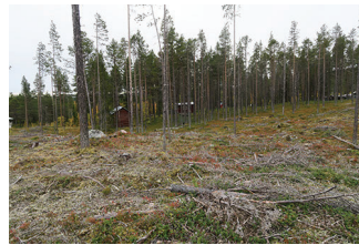
VBM DB 618_015.JPG