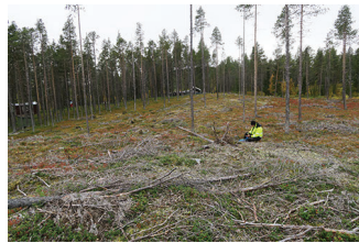
VBM DB 618_014.JPG