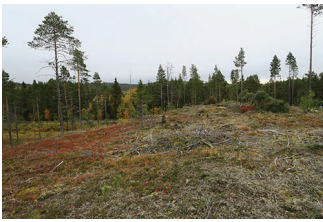
VBM DB 618_009.JPG