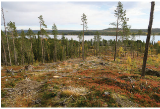
VBM DB 618_005.JPG