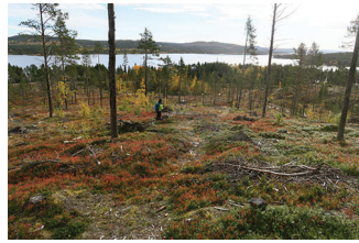
VBM DB 618_006.JPG