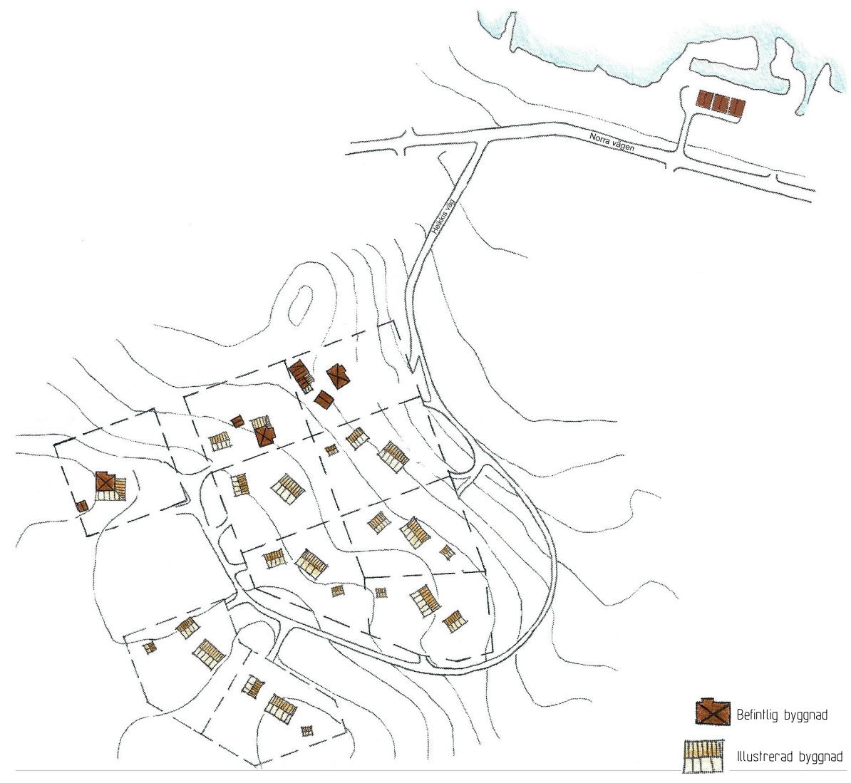
ILLUSTRATION (skala 1:3000 i A2-format)

Detaljplan för del av fastigheten KURRAVAARA 3:3 m.fl. Kurravaara, KIRUNA KOMMUN, Norrbottens län KIRUNA KOMMUN, plankontoret oktober 2013 rev. november 2013