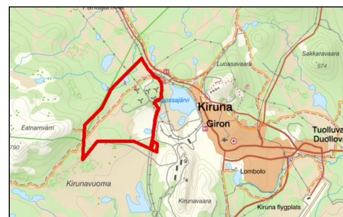
Planområdet markerat i rött

Planförslaget möjliggör för gruvindustri inom ett område om 1 071 ha som sedan tidigare främst är planlagt för aktuell markanvändning.