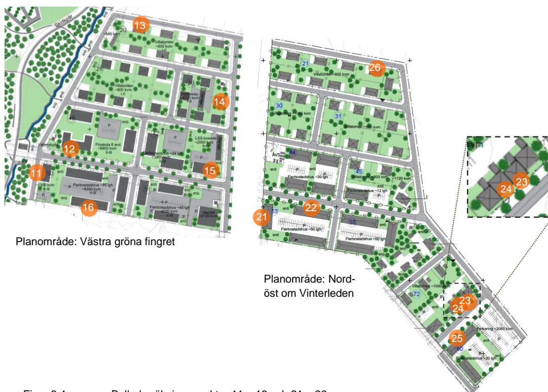
Figur 3-1 Bullerberäkningspunkter 11 – 16 och 21 – 26.

Ekvivalenta och maximala ljudnivåer har beräknats i ett antal punkter vid fasaderna på de nyplanerade husen, vid + 2 m ovan mark , se figurerna nedan. De flesta bullerberäkningspunkterna har valts utifrån att de bedöms vara de mest bullerutsatta i planområdena. Några av punkterna är vid lågt trafikerade gator för att visa ljudnivåerna även här (punkt 11, 13 och 26).