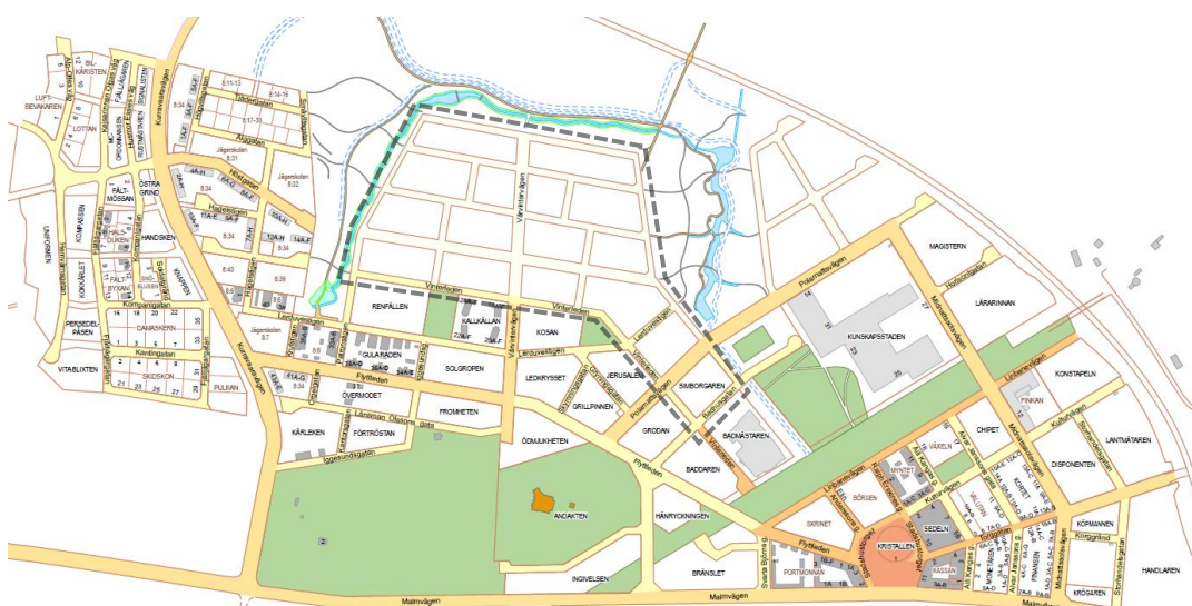
Figur 1-1 Nya Kiruna centrum - planområdena Västra gröna fingret och Nordöst om Vinterleden markerat.

Ny bostadsbebyggelse planeras inom planområdena Västra gröna fingret och Nordöst om Vinterleden i Kiruna. Planområdena är belägna på var sin sida om Vårvintervägen och norr om Vinterleden, se i figurerna nedan.