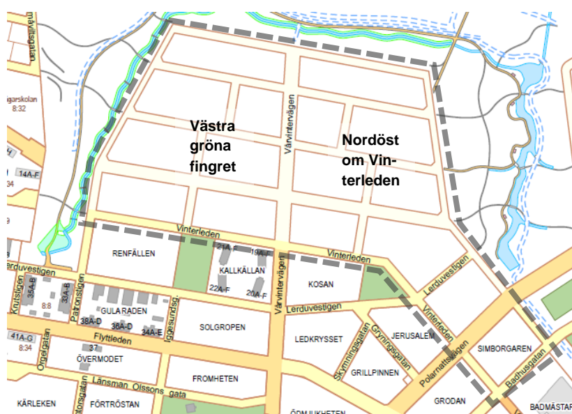
Figur 1-2 Planområdena Västra gröna fingret och Nordöst om Vinterleden .