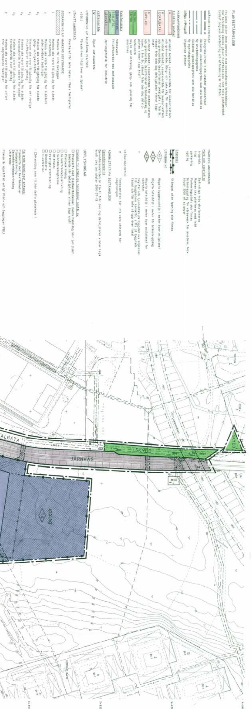
Plankarta del 1 ej skalenlig

Gränslinje för upphävande av detaljplan för område för vilket detaljplan avses upphävas. Laga kraft 1992-07-14 □ Gränsbeteckning ▨ Upphävande ■ Planbestämmelser Detaljplan Del av BOLAGET KV VÄRMEN m m KIRUNA KOMMUN Norrbottens län Upprättad i december 1997