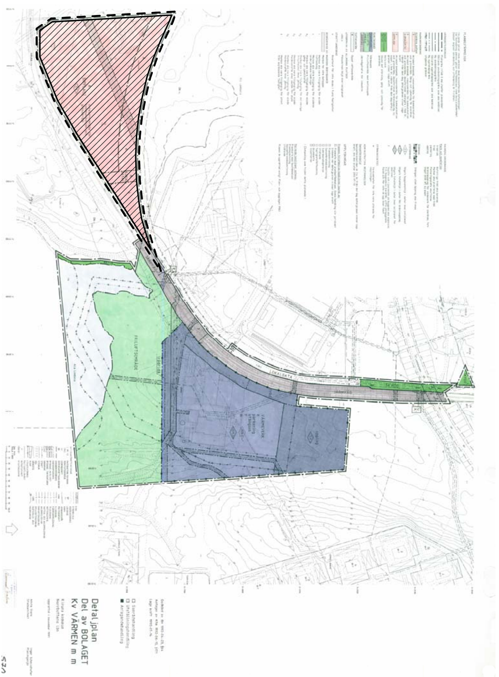
Plankarta del 1 ej skalenlig