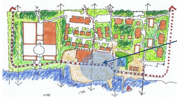
Illustration från planprogrammet som visar den nya "ishallen" och ateljéer i väster, genomsiktligt, gångstråket och läget på den nya byggnaden för konferenser, möten i områdets östra del. Under vintertid är ishotellet och kapellet i bruk och placeras väster om den nya byggnaden fram till större befintlig byggnad för omklädnad och förvaring.