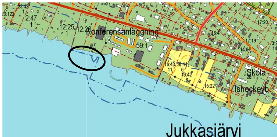
Kartan visar felaktigt att strandskyddet är upphävt inom i denna plan berört vattenområde. Området är inringat.

Särskilda skäl för att undanta strandskyddet är att verksamheten har bedrivits i området i flera års tid och därigenom är området redan ianspråktaget för enskilda ändamål (18c§1) varför fri passage för allmänheten och livsvillkoren för djur- och växtlivet inte kan tillgodoses till fullo. Is från Torne älv tas upp till hallen inom området varför verksamheten kräver direktkontakt med vattnet vintertid (18c§3). Bryggor och båtångöring har stora värden för verksamheten. Särskilt skäl för att upphäva strandskyddet inom vattenområdet för bryggor [W 1 ] är att dessa kräver direkt koppling till vattnet (18c§3). En administrativ planbestämmelse om att strandskyddet inom kvartersmark och vattenområde för bryggor är upphävt införs. På kartan nedan är gällande strandskydd redovisat med punkt-prickad linje.