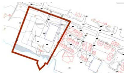
Vattenområde enligt Miljöbalkens definition (skrafferat på kartan).

Tillsammans med Länsstyrelsen har kommunen kommit överens om att mark som ligger lägre än +323,0 ska enligt Miljöbalkens definition betraktas som vattenområde (skrafferat på kartan nedan). Ny bebyggelse bör inte ha lägre färdig golvhöjd än cirka +324,7, exakt nivå bestäms vid bygglovprövningen.