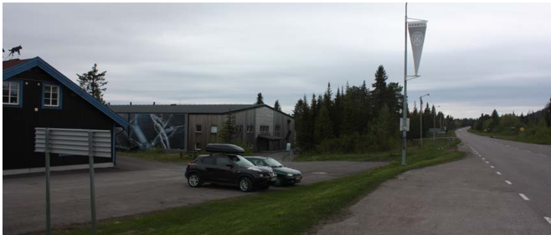
Foto från nordost, Marknadsvägen till höger.