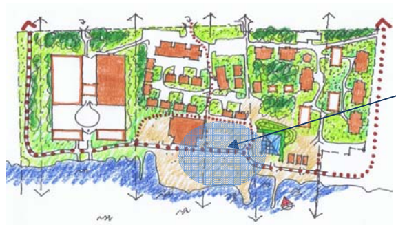
Illustration från planprogrammet som visar den nya "ishallen" och ateljéer i väster, genomsikt, gångstråket och läget på den nya byggnaden för konferenser, möten i områdets östra del. Under vintertid är ishotellet och kapellet i bruk och placeras väster om den nya byggnaden fram till större befintlig byggnad för omklädnad och förvaring.