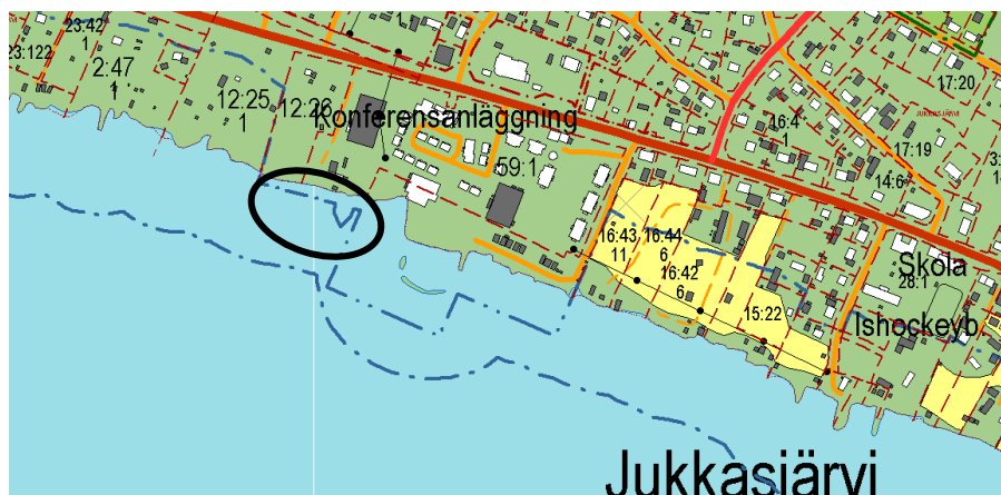
Kartan visar felaktigt att strandskyddet är upphävt inom i denna plan berört vattenområde. Området är inringat.