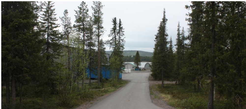
Utblick från Marknadsvägen ned mot Torne älv.

I planen införs bestämmelser inom vissa områden (träd) om att det krävs marklov för att fälla träd med större diameter än 10 centimeter mätt 1 meter över omgivande mark.