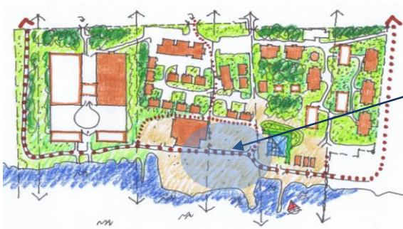
Illustration från planprogrammet som visar den nya "ishallen" och ateljéer i väster, genomsikter, gångstråket och läget på den nya byggnaden för konferenser, möten i områdets östra del. Under vintertid är ishotellet och kapellet i bruk och placeras väster om den nya byggnaden fram till större befintlig byggnad för omklädnad och förvaring.