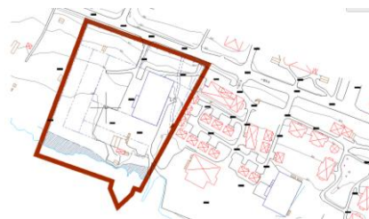
Vattenområde enligt Miljöbalkens definition (skrafferat på kartan).

Tillsammans med Länsstyrelsen har kommunen kommit överens om att mark som ligger lägre än +323,0 ska enligt Miljöbalkens definition betraktas som vattenområde (skrafferat på kartan nedan). Ny bebyggelse bör inte ha lägre färdig golvhöjd än cirka +324,7, exakt nivå bestäms vid bygglovprövningen.