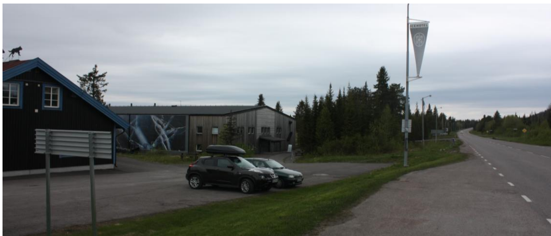
Foto från nordost, Marknadsvägen till höger.