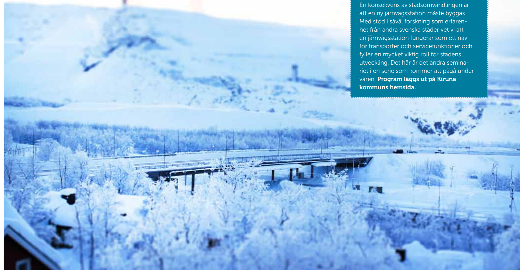
Gruvvägsbron till LKAB:s industriområde stängs i sommar. Det innebär att trafiken måste läggas om. LKAB planerar en ny tillfällig in- och utfart och förslaget är att vägen ska gå via E10 vid fiskodlingen.

som kan uppstå vid stängningen av Gruvvägen måste utredas vidare. Detta har kommunen tydligt framfört till Trafikverket. Det får inte bli oönskad genomfartstrafik genom staden ned till LKAB:s infart, säger Christer Vinsa. ■